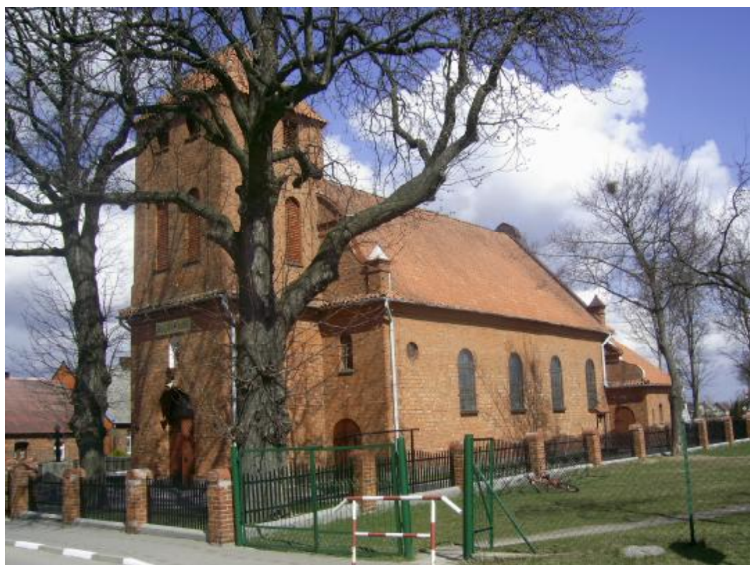
Rys.3. Widok na wieś