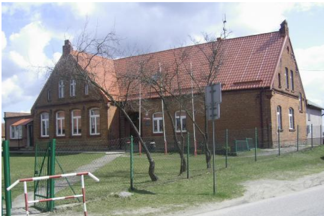
Rys.2. Widok na wieś

Natomiast na rysunkach 2, 3, 4 oraz 5 zawarto zdjęcia wybranej części wsi wraz z widokiem na jezioro.