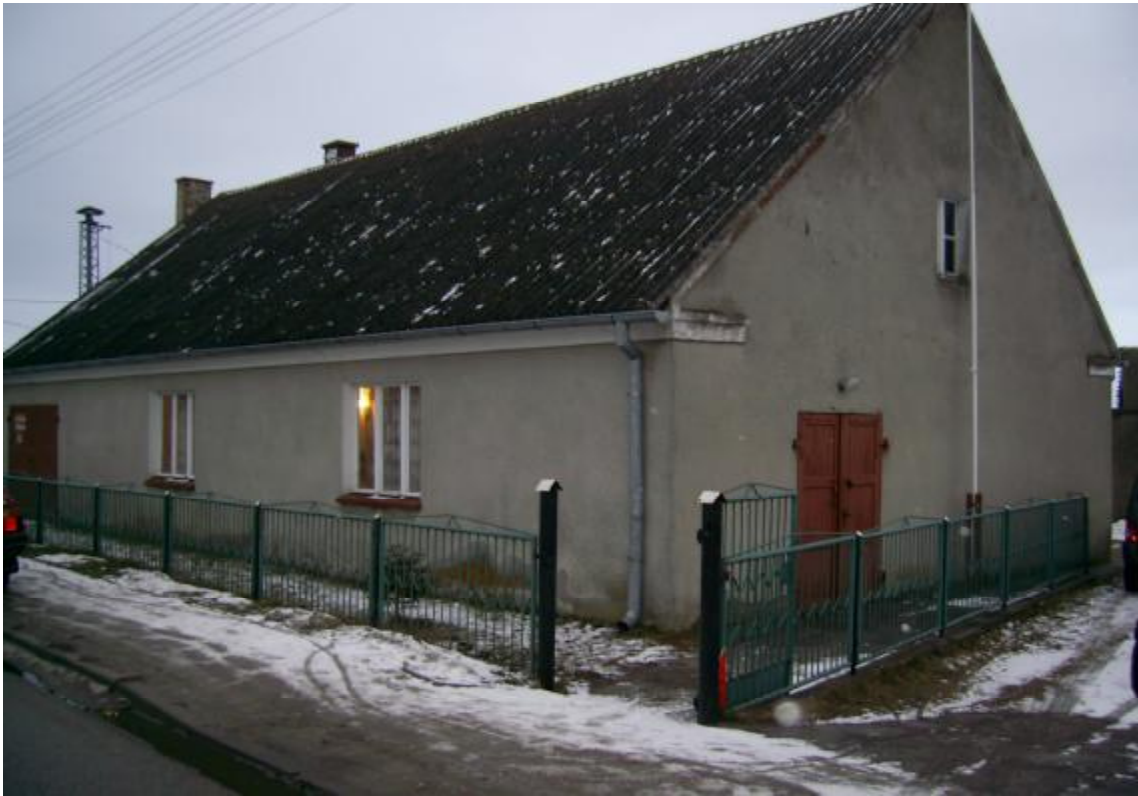
Rys. 4 Widok na świetlicę