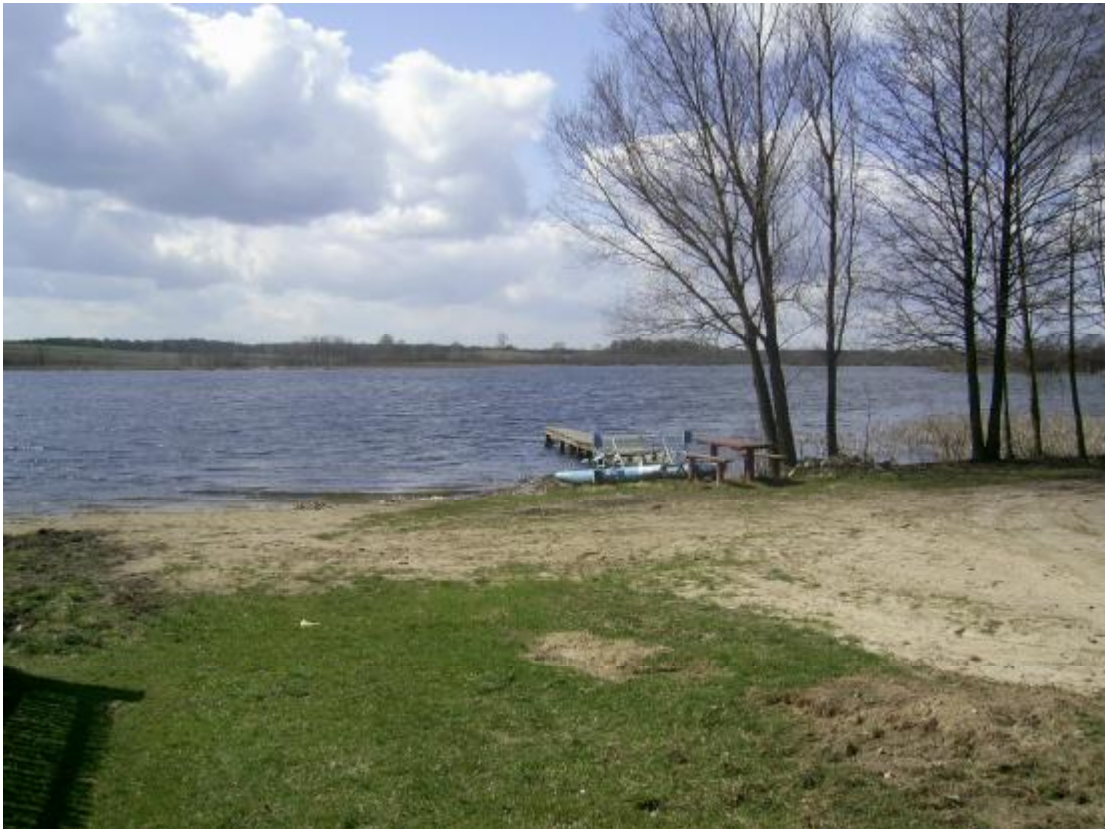
Rys. 5 Widok na jezioro